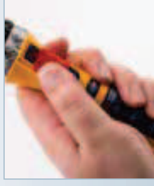
Déclenchement d'une main