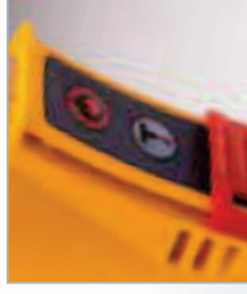
Glissez le capot pour déclencher